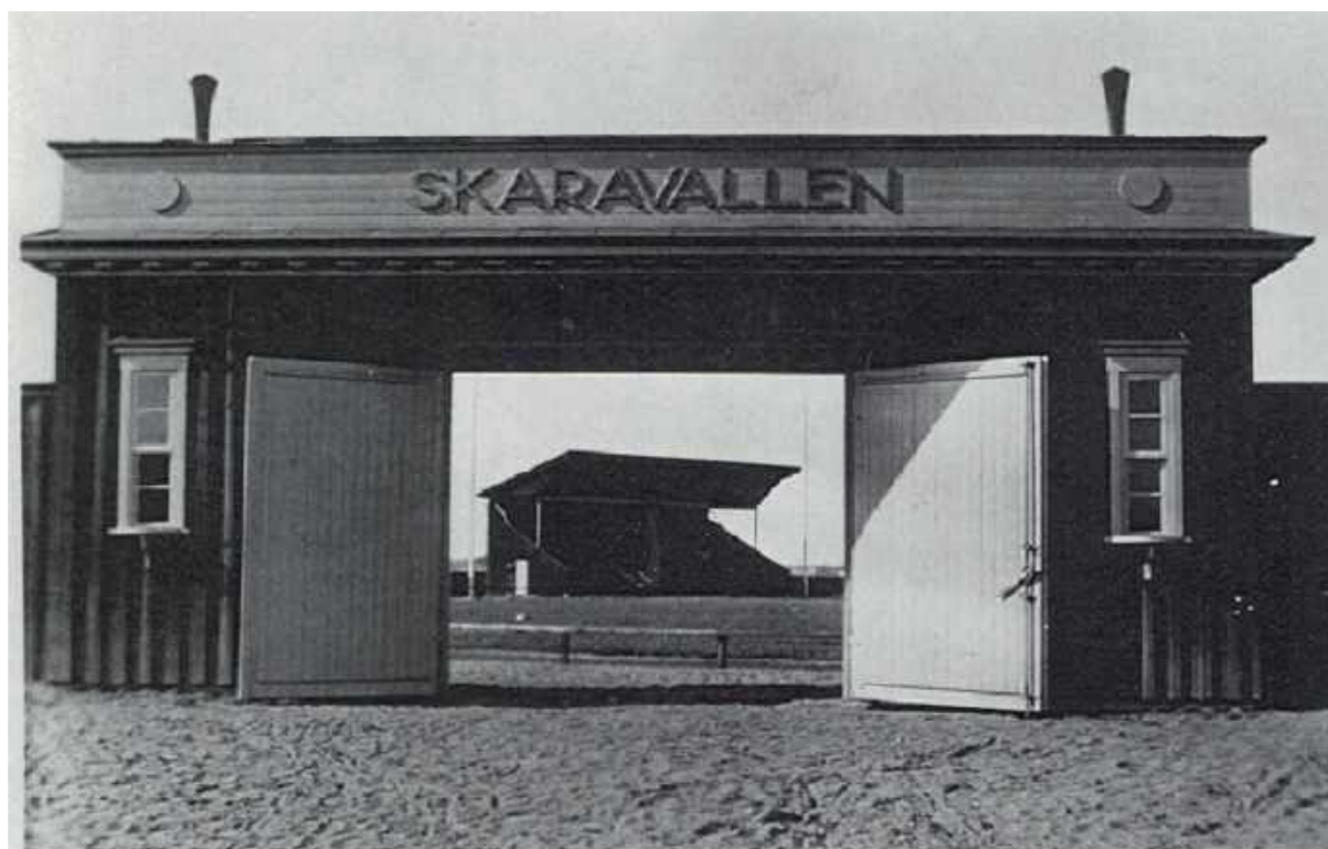
Skaravallen 1932-05-18, Hindspogatan 532 32 Skara.