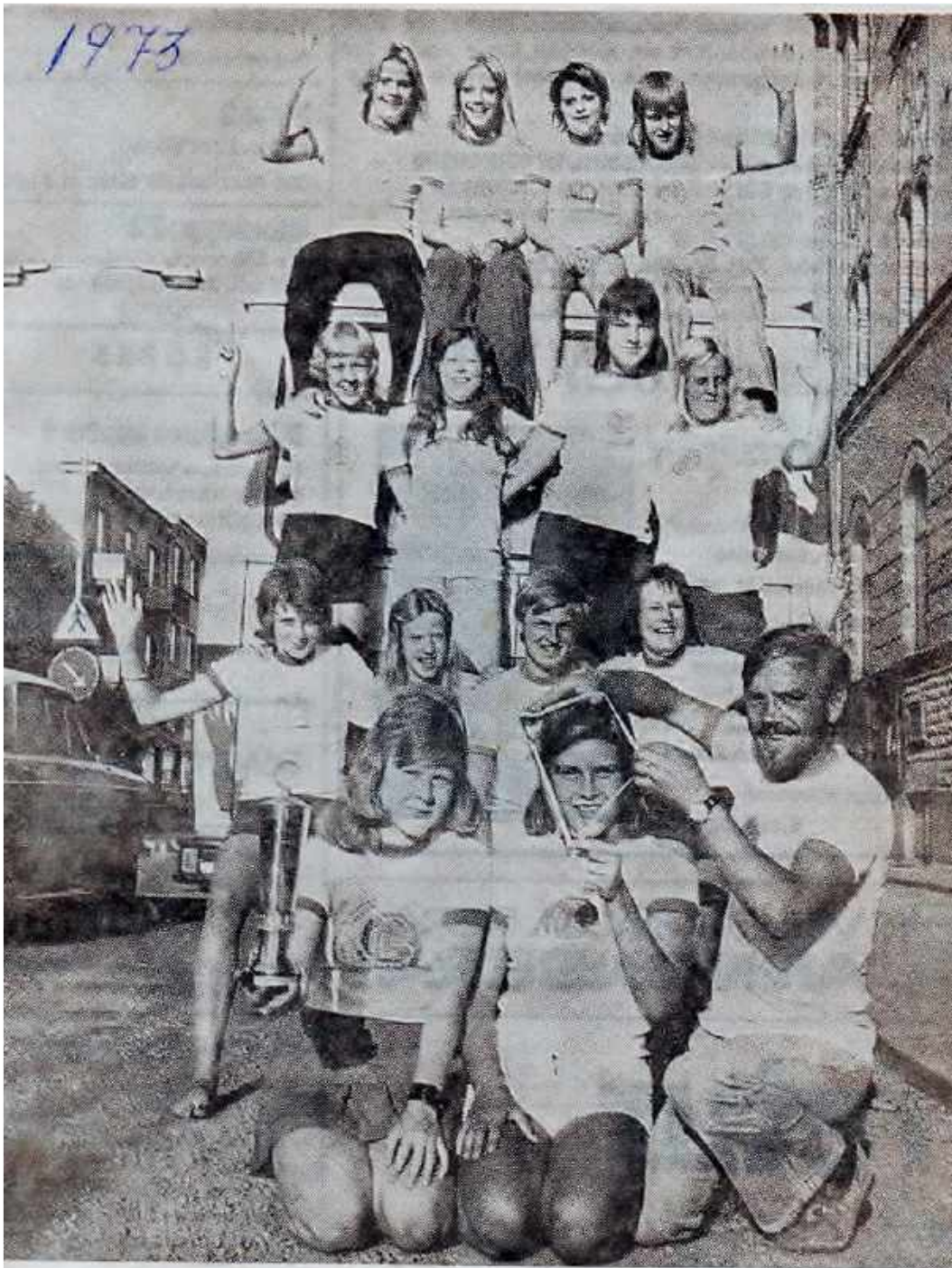
Det var uppåtvärre i det hemvändande Stenumslaget. Och tacka för det. Det är inte var dag man kommer tvåa i världens största handbollsturnering.