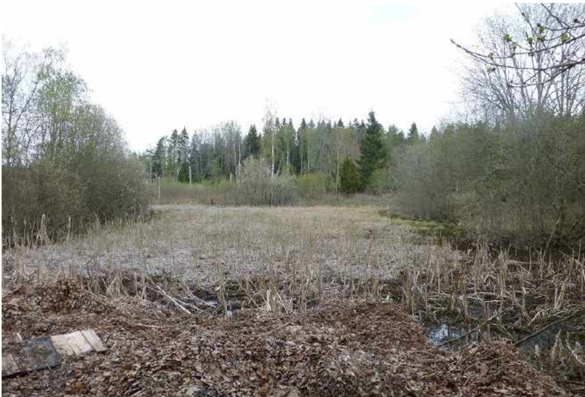
Stenums IF, ishockeyplan.