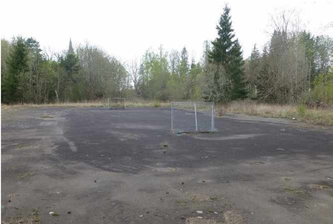
Stenums IF, handbollsplan.