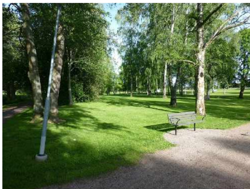
Minigolfbana vid Viktoriasjön i Skara.