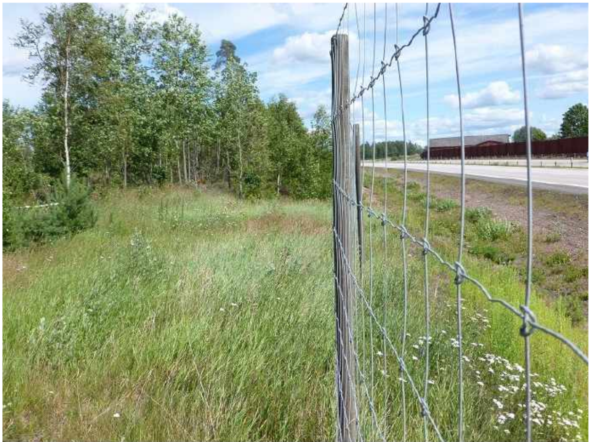
Cykelcrossbana, Brunsbo öster om Skara, väg 49 till höger mot Skövde.