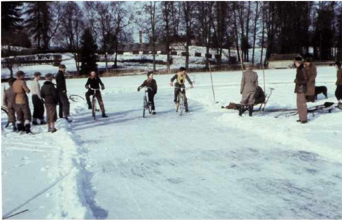
Cykeltävling på Flämsjön