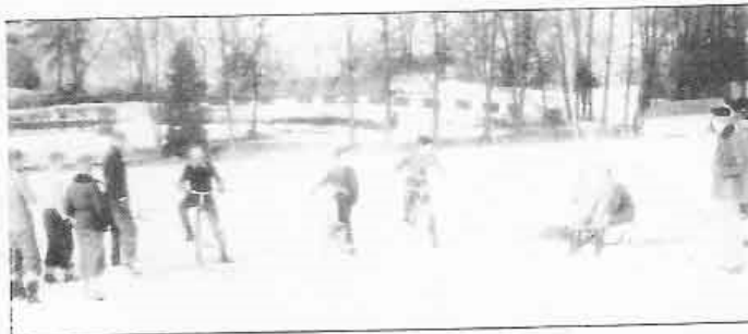
Start för isracing på Flämsjö.

Klubben funderade på att bygga en cykelcrossbana. Några av pojkarna, som bodde vid Brunnsbo, ett gammalt biskopssäte ca tre kilometer öster om Skara, fann ett lämpligt område. Start- och målstråket var på grusvägen mellan Brunnsbo och Tubbetorp. Runt 60 % av banan gick i skogen. - Vi rensade bort stubbar och buskar och lade på grus, berättar Nils Bragd. Vi fick hjälp av de äldre med att fälla träd som stod i vägen. Naturligtvis gjordes allt med markägarens tillstånd.