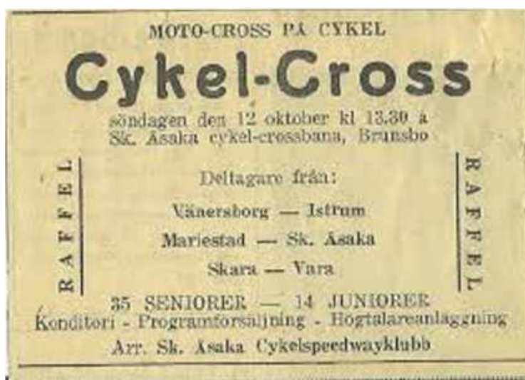
Biljett Skånings Åsaka Cykel-Cross Brunsbo, Skara.

Cykelcrossbana vid Fågelås Isracing på heden i Axvall. Tävlingar 1952 Isracing 27 januari. Cykelspeedwaytävlingen våren 1953 med tävlande från Vänersborg, Istrum, Skara, Vara, Mariestad, Åsaka, drog en publik på 600 personer. Banan 3,5 km kördes tio varv av juniorer och fem av seniorer. 19 oktober arrangerades cykelorientering. 21 oktober en tillförlitlighets-tävling med trialprov på en fem km lång bana.